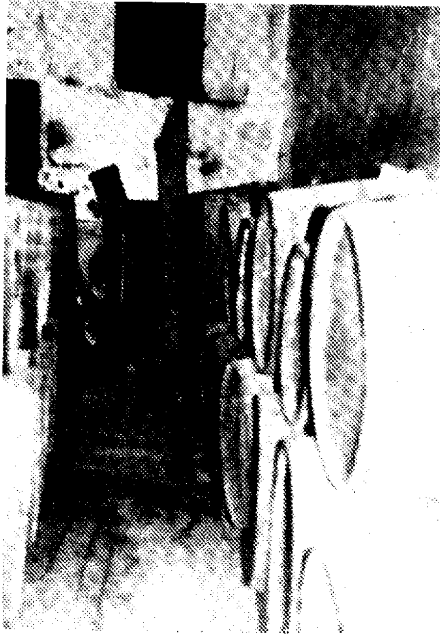
Interior de una bodega típica de Castilla.