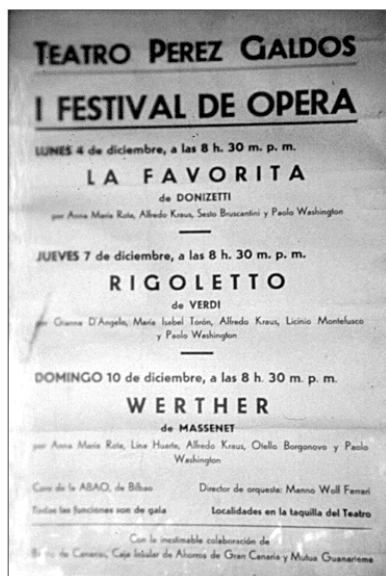
Fig. 1 Cartel del I Festival de Ópera de Las Palmas de Gran Canaria, 4-10 de diciembre de 1967.

El Festival de Ópera de Las Palmas de Gran Canaria ha sido organizado y promovido por la asociación Amigos Canarios de la Ópera (A.C.O.) , con un carácter anual y continuo desde el año 1967 hasta la actualidad. Cuenta ya, por tanto, con más de tres décadas de existencia a lo largo de las cuales han tenido lugar, en el ámbito del Teatro Pérez Galdós , centenares de representaciones en las que se ha podido ver y escuchar casi de todo.