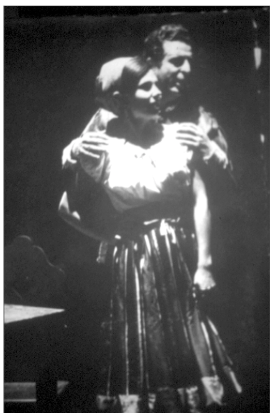
Fig. 2 Alfredo Kraus y M ª Isabel Torón Macario durante la representación de Rigoletto en el Teatro Pérez Galdós (7-XII- 1967)

Desafortunadamente, la fructífera relación que propició el comienzo de lo que iba a ser una larga trayectoria de festivales anuales de ópera en nuestra ciudad, se rompió durante la