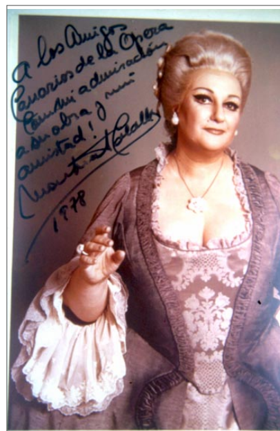
Fig. 5 Fotografía dedicada por Montserrat Caballé a los Amigos Canarios de la Ópera en 1978.

Esta década se caracteriza por la numerosa participación de cantantes nacionales de primera línea. Son los años en que actuaron José Carreras , Plácido Domingo , Montserrat Caballé y Jaime Aragall , quienes intervinieron en diversas ocasiones, a veces arropados por el calor y reconocimiento del público, y otras criticados por los aficionados más exigentes. 14 Es lógico suponer que las deficiencias de la puesta en escena trataran de compensarse con la expectación y entusiasmo que debían provocar las primeras figuras de la lírica nacional.