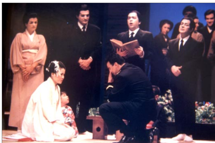
Fig. 7 Representación de Madame Butterfly en 1995.

y Damaret , respectivamente, desempeñando un importante papel en los demás elementos de escena el equipo técnico del Teatro Pérez Galdós .