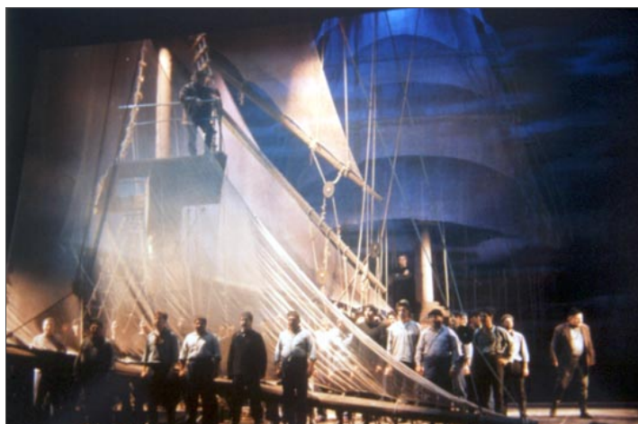
Fig. 6 Representación de El holandés errante en 1994. Escenografías del Teatro Colón de Buenos Aires.

Por último, elementos tan indispensables como el vestuario , el atrezzo y la peluquería , han correspondido en su mayoría a empresas de Madrid y Barcelona, como Cornejo, Mateos