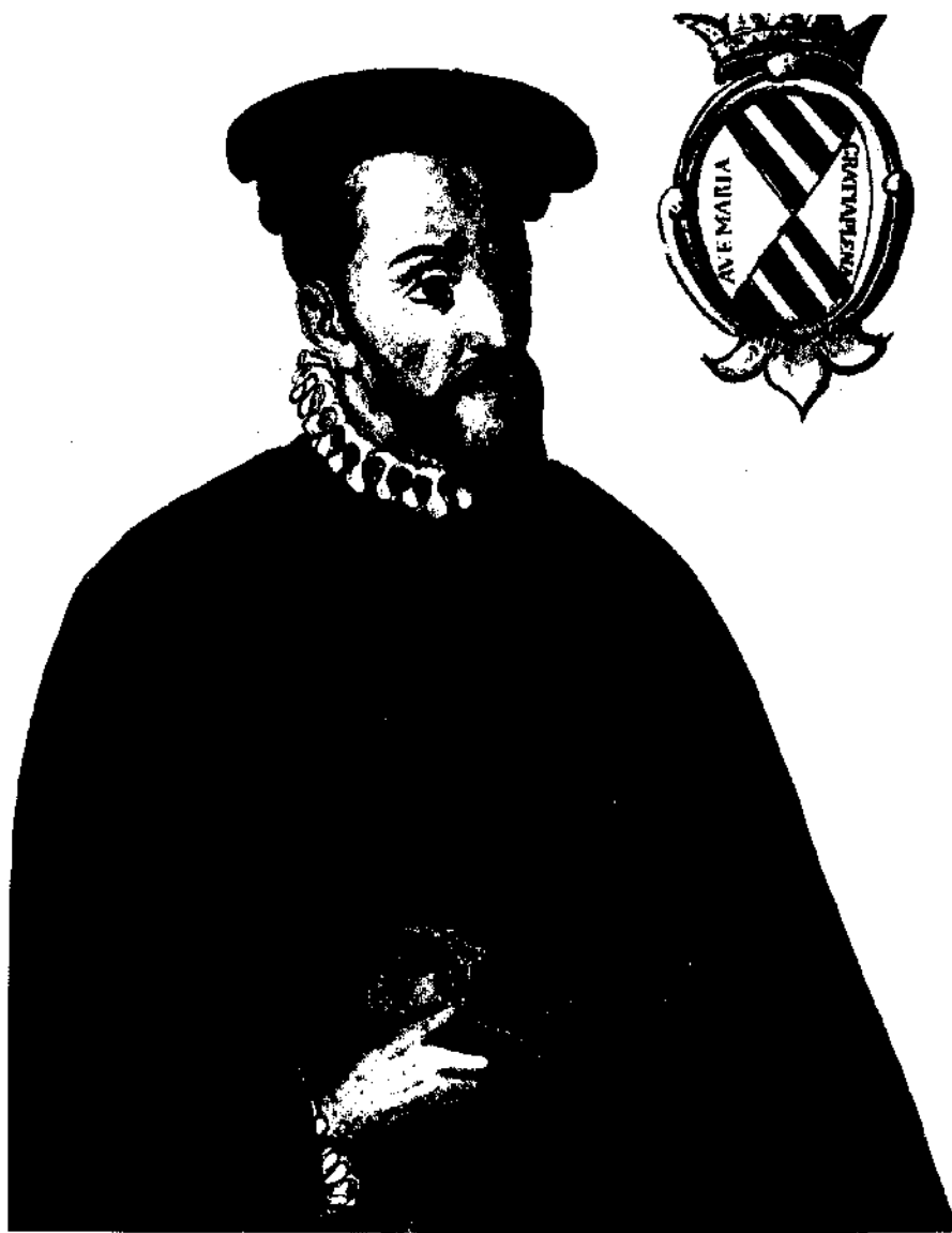
El virrey don Antonio de Mendoza, fundador en la Nueva España de varias ciudades con toponimia castellano-leonesa.